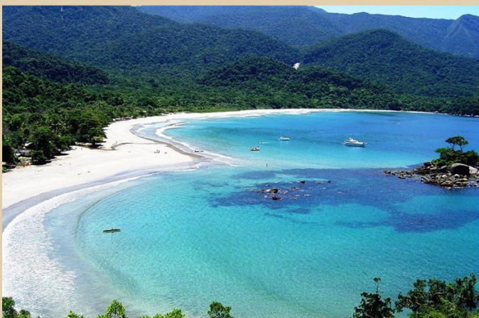
foto de Ilhabela